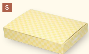
S 10-160 デリボックスS ヤ サイズ:163×108×32.5 入数:500 重量:27g ●材質:カード/紙+内面耐水耐油コート