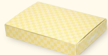
L 10-162 デリボックスL 有 ヤ サイズ:206×145×33 入数:300 重量:40g ●材質:カード/紙+内面耐水耐油コート