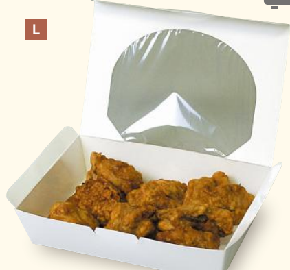
L 10-132A デリエコパックL ヤ サイズ:180×120×40(底165×105) 入数:600 重量:21g ●材質:ウルトラH320g/㎡(内側PET貼)