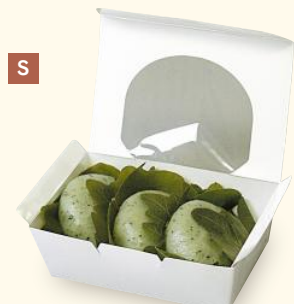
S 10-130A デリエコパックS ヤ サイズ:120×80×40 (底105×65) 入数:600 重量:10g ●材質:ウルトラH320g/㎡(内側PET貼)