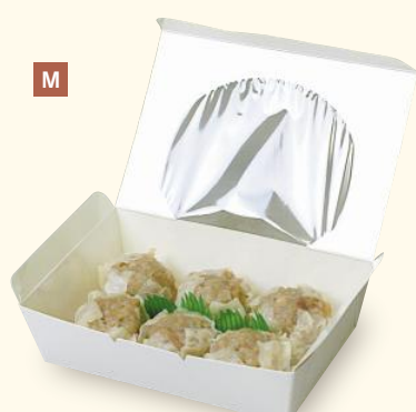
M 10-131A デリエコパックM ヤ サイズ:150×100×40(底135×85) 入数:600 重量:18g ●材質:ウルトラH320g/㎡(内側PET貼)